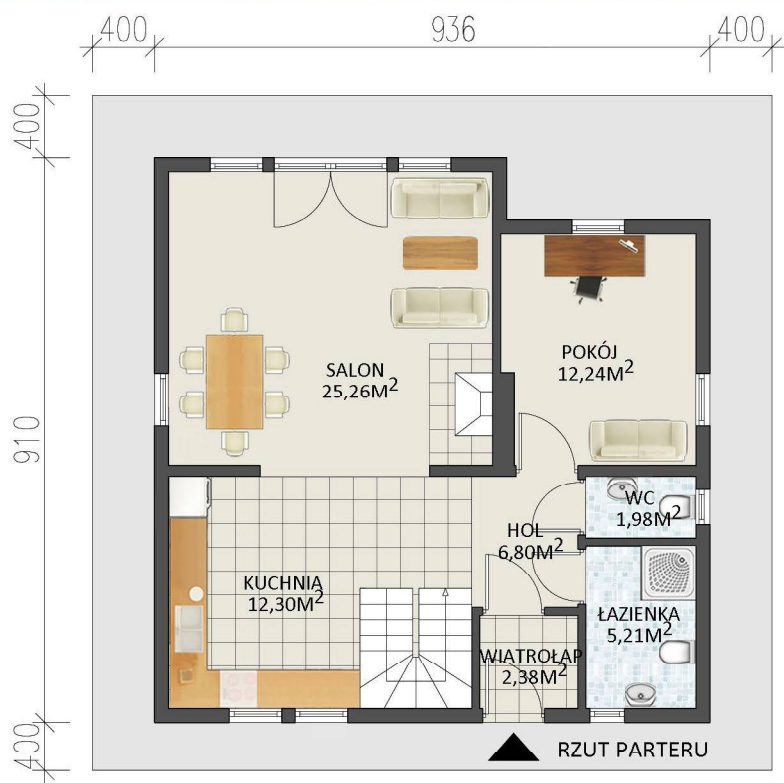
BESKIDY 128 MINIMALNE WYMIARY DZIAŁKI 17,36 M X 17,10 M